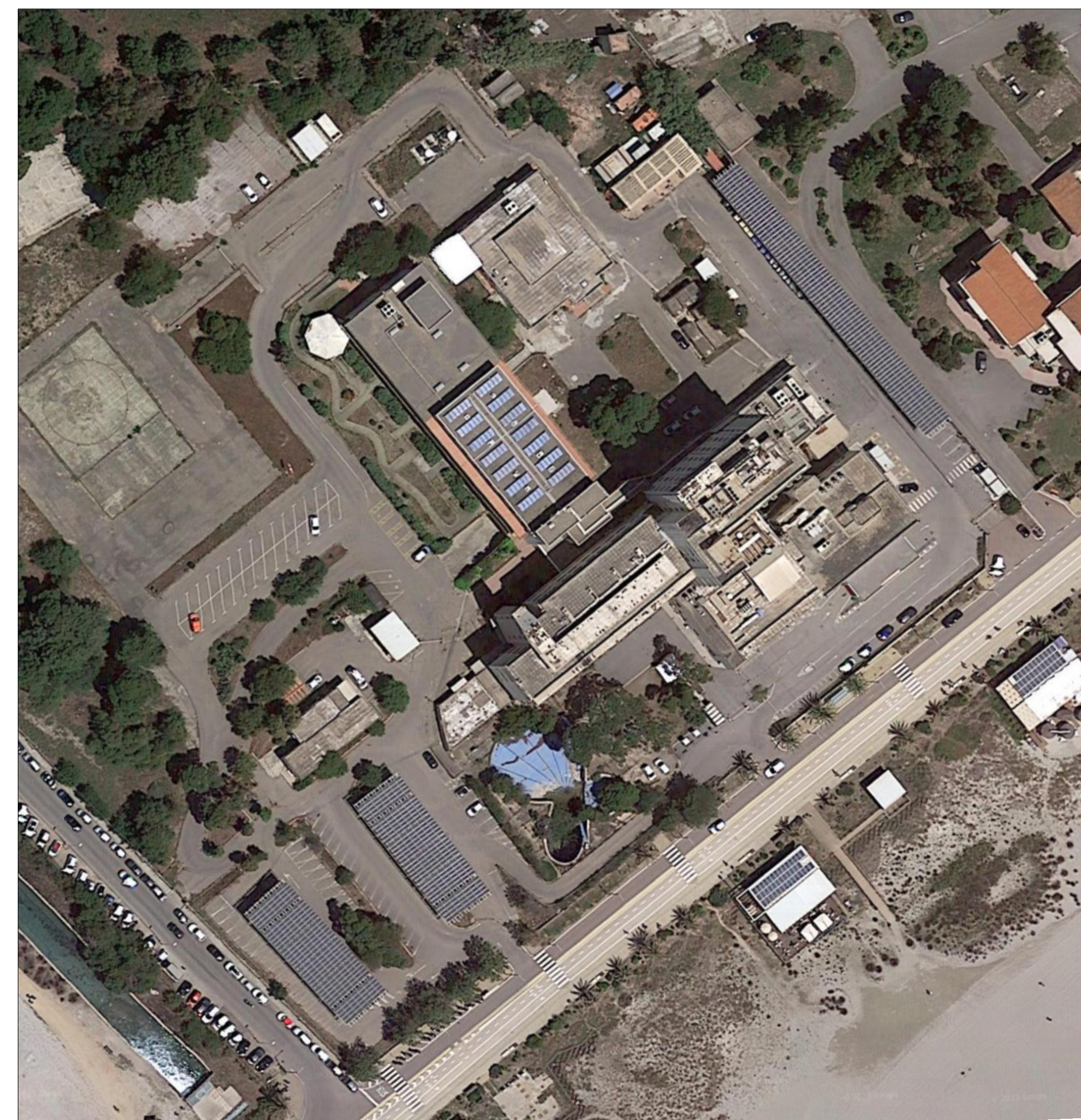
Ortofoto scala 1:1000