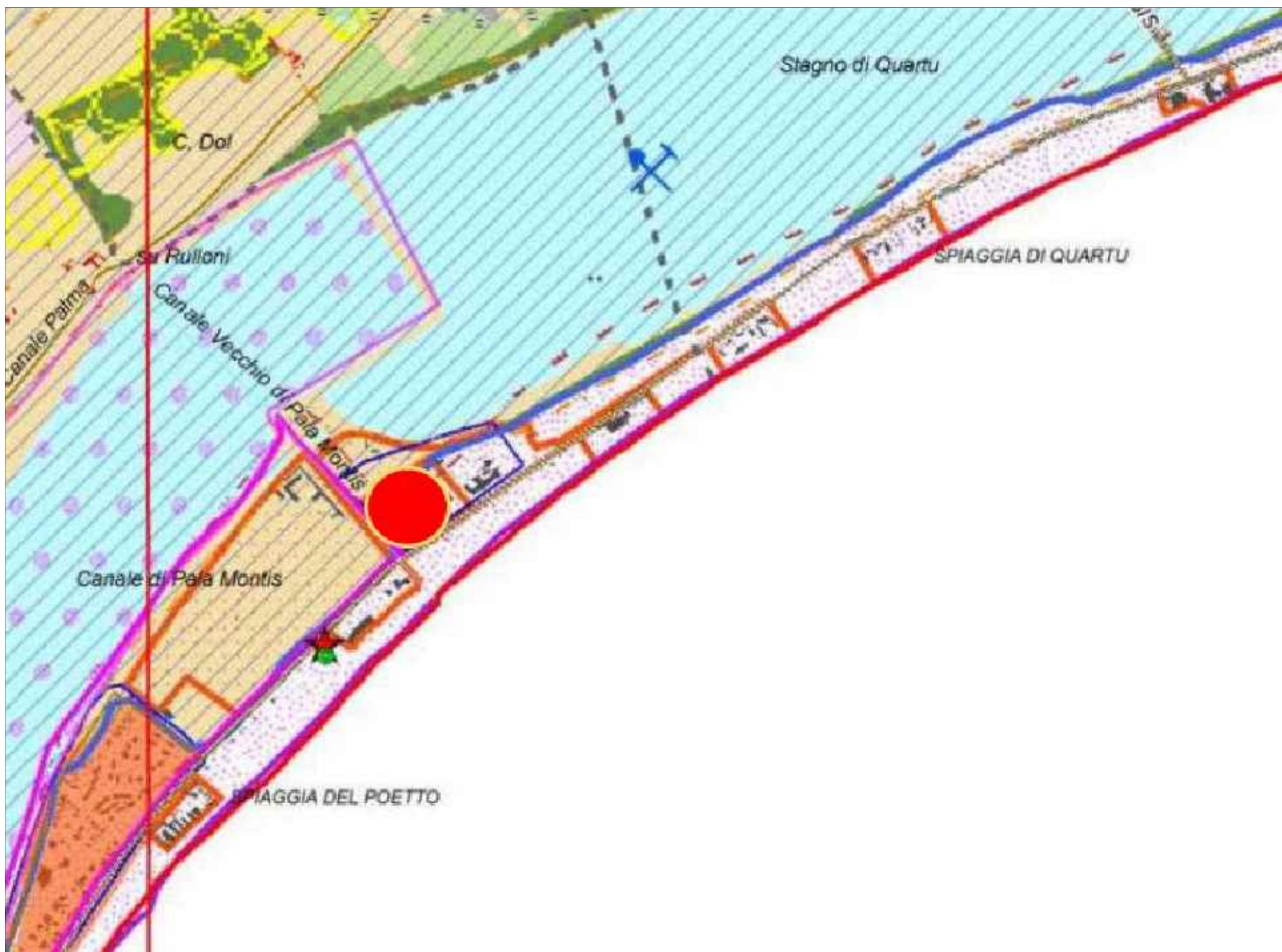
P.P.R. Sardegna – Ambito n. 1 Golfo di Cagliari ... A1 – 557 sez. II