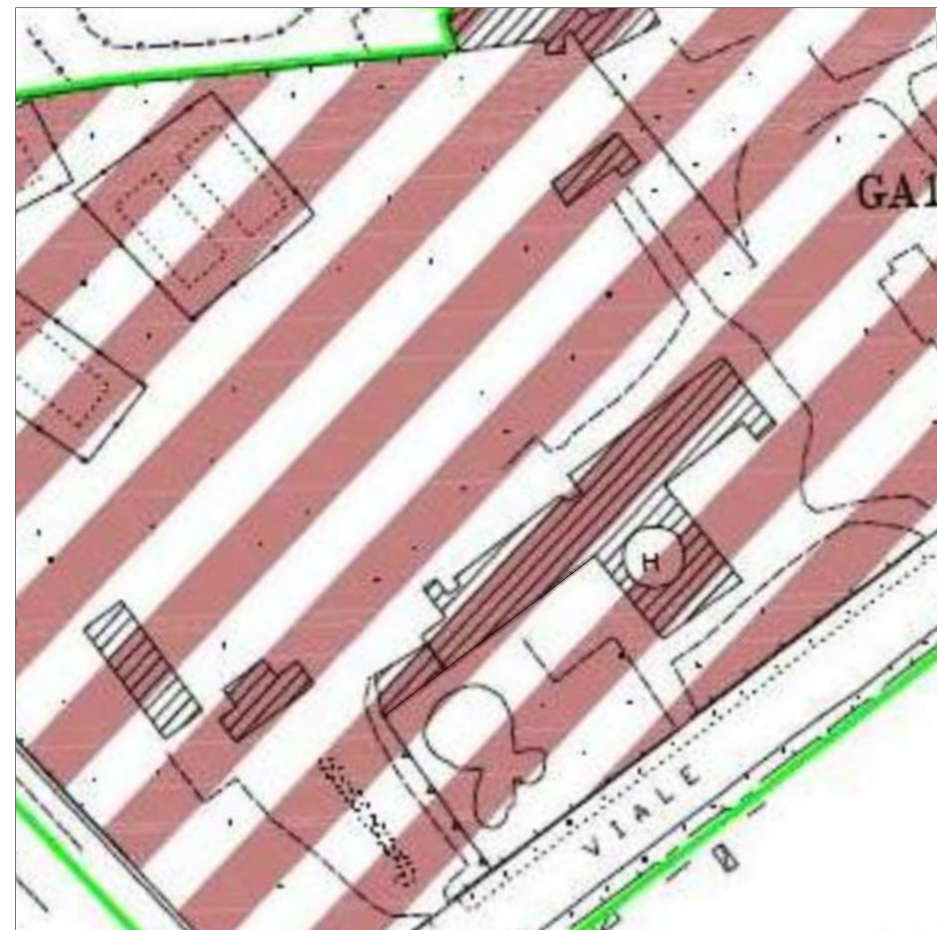
Comune/CA – Tavola E4-19 Scala: 1/1000 Zona G – Ambiti di Trasformazione/Sottozona GA1 – Attrezzature pubblico-private di 1° livello, del vigente Piano Urbanistico Comunale del Comune di Cagliari.